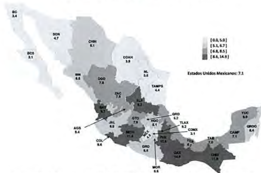
Tasa de ocupación no permitida por entidad federativa, 2019 (Porcentaje respecto a la población de 5 a 17 años)