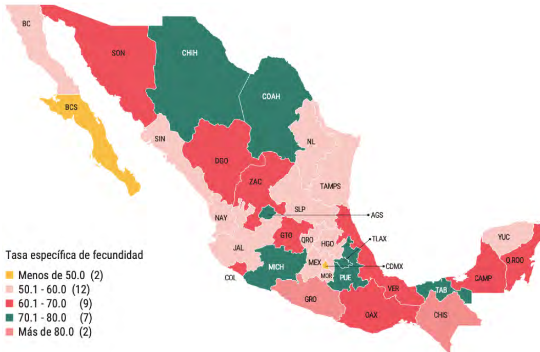
Mapa 1. Tasa específica de fecundidad en mujeres de 15 a 19 años Entidades federativas en México, 2019. Tomado de Arvizu Reynaga, Alma Vanessa. Embarazo temprano en México: panorama de estrategias públicas para su atención / Vanessa Arvizu, Laura Flamand, Melisa González y Juan C. Olmeda. – 1a ed. – Ciudad de México, : El Colegio de México, Red de Estudios sobre Desigualdades, 2022.

En ese entendido, destacan algunos documentos internacionales donde se enmarca a la educación como una vía indiscutible del desarrollo humano, destacan por ejemplo, el Pacto Internacional de Derechos Económicos, Sociales y Culturales, mismo que a la letra dice: