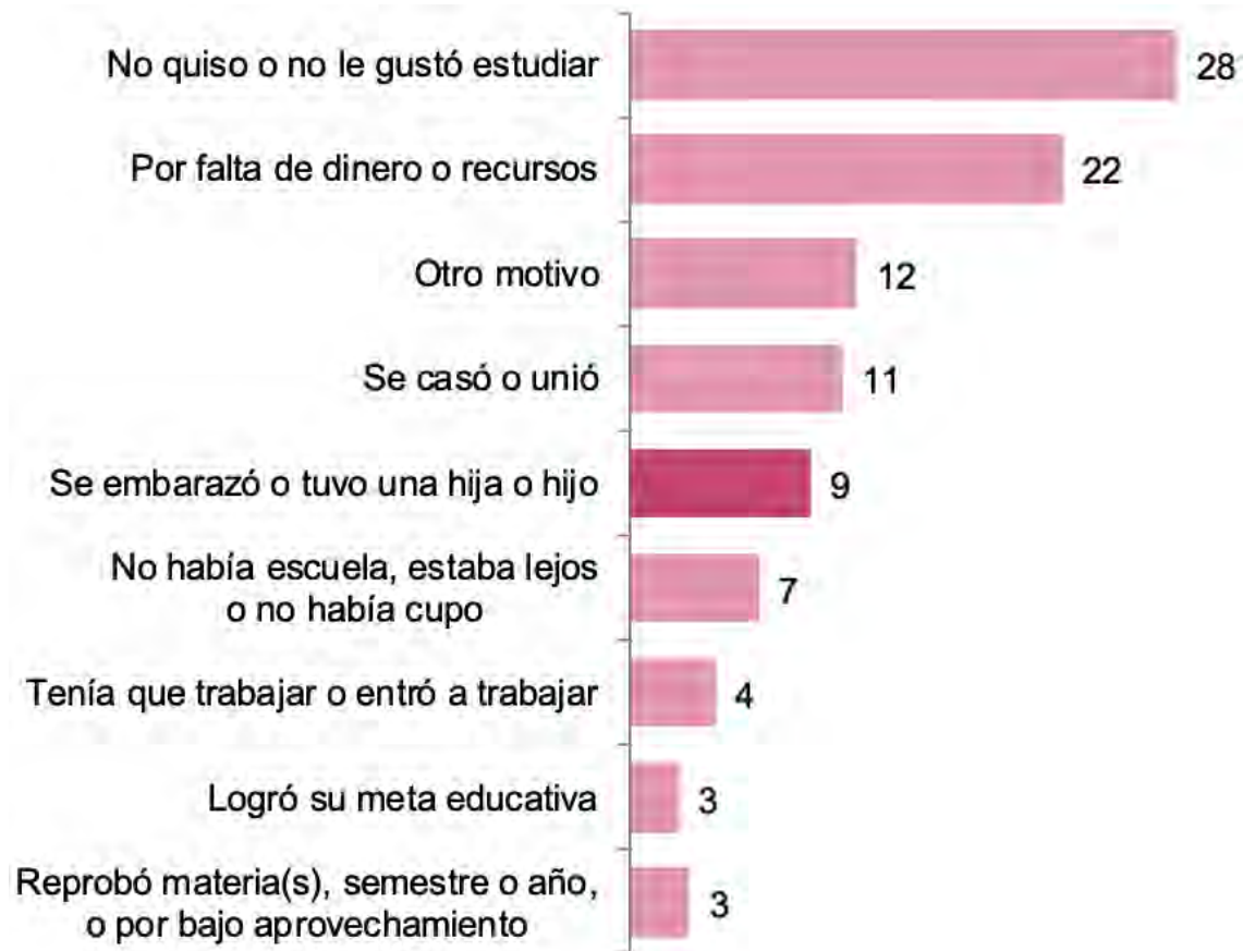
Gráfica 1. Distribución porcentual de las mujeres de 15 a 19 años que no asisten a la escuela, por causa de abandono escolar, 2018. Tomado de INEGI. (2021) Estadísticas a propósito del día mundial para la prevención del embarazo no planificado en adolescentes (datos nacionales). Instituto Nacional de Estadística y Geografía, comunicado de prensa núm. 536/21. Pp. 2.

Para el trienio 2006 – 2008 la tasa de embarazo adolescente era de 70.9 por cada 1 000 mujeres de 15 a 19 años; para 2011 – 2013 se incrementó a 77.0 nacimientos y en el trienio 2015 – 2017 fue de 70.6 nacimientos. Por otra parte, para 2018, del total de adolescentes de 15 a 19 años, 16% reportaron un antecedente de embarazo; proporción que aumenta a 39% en adolescentes que no asisten a la escuela.