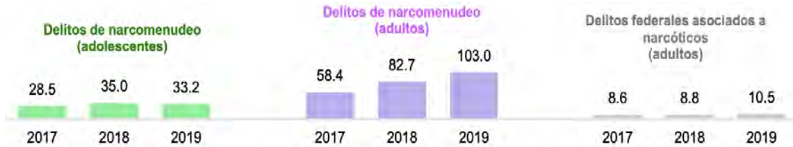
Gráfica 2. Tasa de delitos relacionados con drogas registrados en carpetas de investigación y averiguaciones previas por cada cien mil habitantes de 12 años y más 2017 – 2019.

Actualmente, México cuenta con pocas organizaciones orientadas a proteger y trabajar con esta población, en cuanto a actividades específicas, el Sistema Nacional de Protección Integral de Niñas, Niños y Adolescentes (SIPINNA), en sus informes de 2015 a 2019, reportó 199 acciones dirigidas a la atención de niñas, niños y adolescentes víctimas de violencia, de las cuales el 30% se orientó a la creación de grupos de trabajo y comités, el 18% a la creación de protocolos, el 17% al acompañamiento y asesoría jurídico y el 12.5% a la capacitación de servidores públicos para que apliquen los protocolos y as metodologías de manera adecuada.