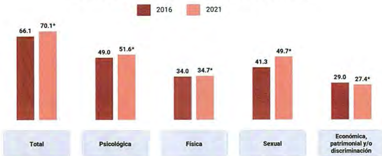
Gráfica 1. Prevalencia de violencia contra las mujeres de 15 años y más a lo largo de la vida por tipo de violencia. Tomado de INEGI. Encuesta Nacional sobre la Dinámica de las Relaciones en los Hogares 2021. ENDIREH. Nacional. 2022